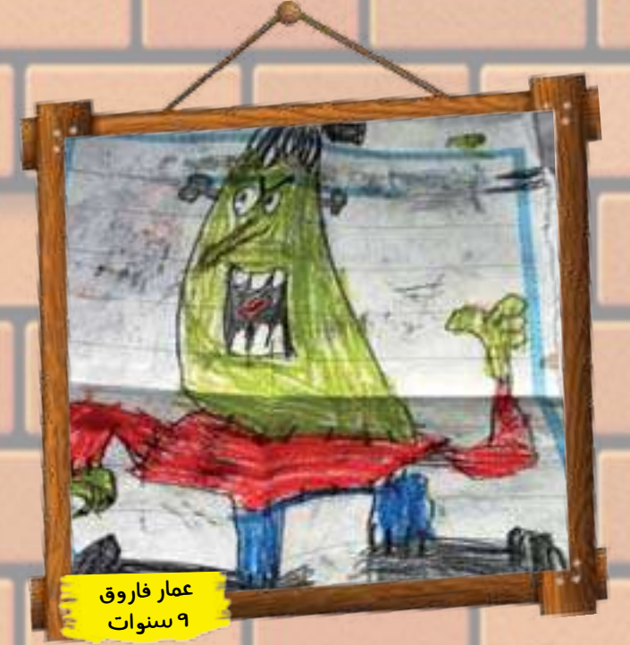
عمار فاروق ٩ سنوات