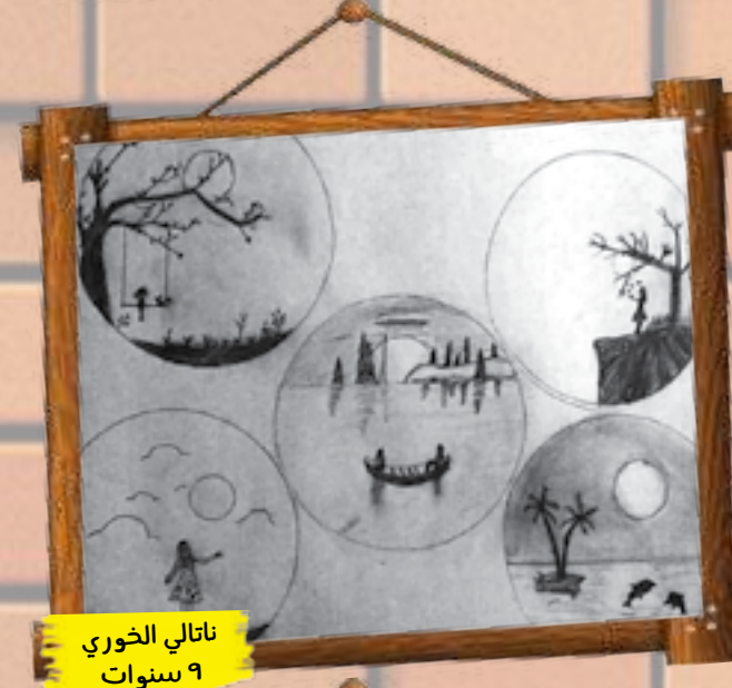
ناتالي الخوري ٩ سنوات