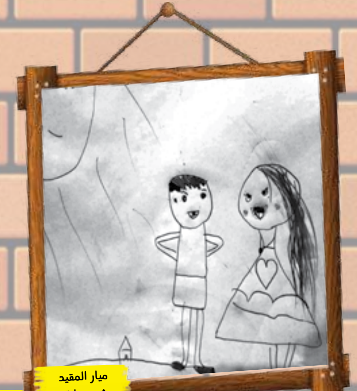
ميار المقيد ٨ سنوات