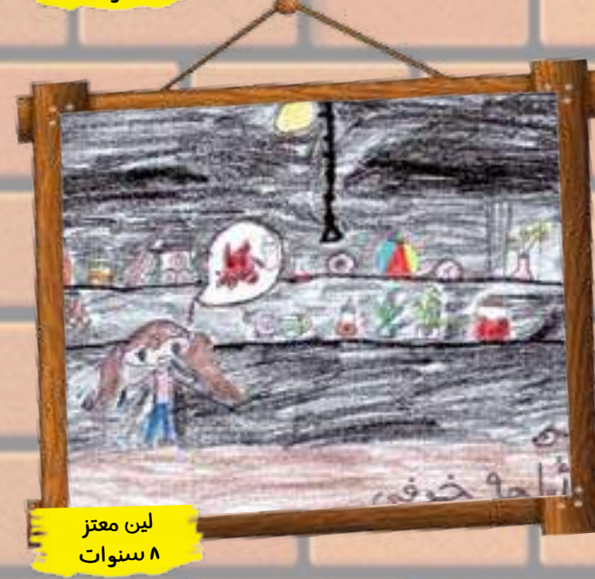
لين معتز ٨ سنوات