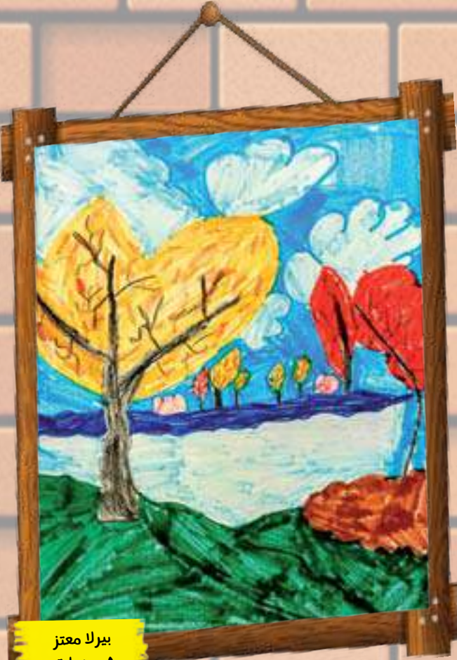
بيرلا معتز ٨ سنوات