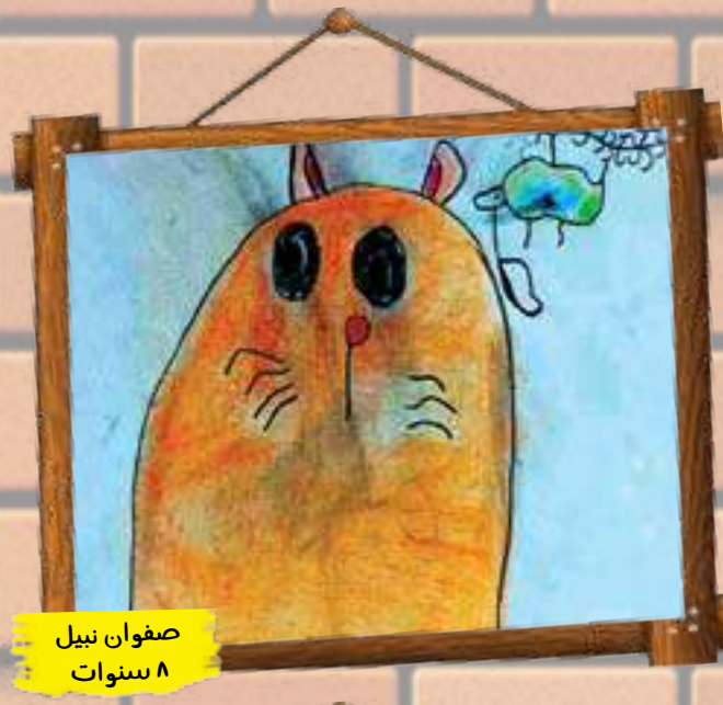
صفوان نبيل ٨ سنوات