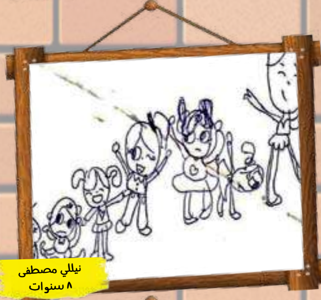
نبلي مصطفى ٨ سنوات