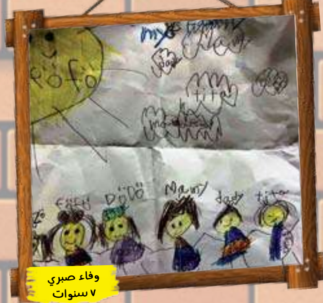
وفاء صبري ٧ سنوات